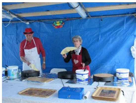
Et sautent les crêpes !!!

Cette année encore, le beau temps n'a pas vraiment été au rendez-vous pour les Musicalies. Sans beaucoup de mouvement derrière l'église, notre stand de crêpes s'est retrouvé bien seul. La recette est en dessous des années précédentes mais le résultat reste tout de même positif.