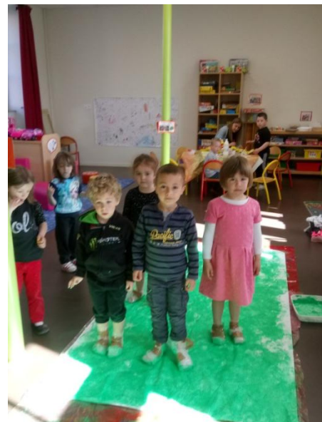
Réalisation d'une fresque avec les pieds