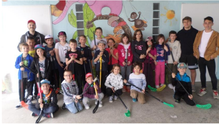
Activité Roller Hockey avec le club de Vierzon

C'est autour du thème « artistes en herbe » qu'une quarantaine d'enfants ont passé leurs vacances.