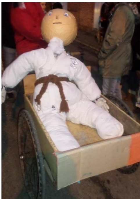
Bonhommes carnivals de Pierrefitte/Sauldre et de Souesmes