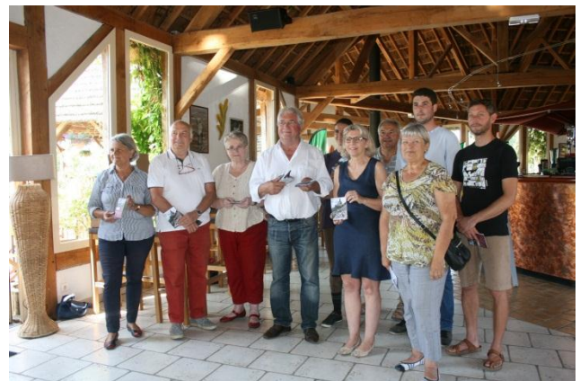
Les Alicourts le 15 juin 2017 – Remise du plan aux hébergeurs

Les personnes âgées de + de 65 ans, les personnes de + de 60 ans inaptes au travail et les personnes handicapées peuvent demander leur inscription sur le registre des personnes vulnérables. Les services sociaux les contacteront en cas de canicule.