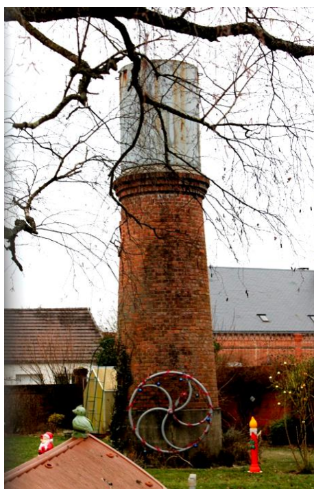
Les Châteaux d'Eau de Pierrefitte

N'oublions pas que tous les foyers n'étaient même pas raccordés à ce réseau dans les années 60.