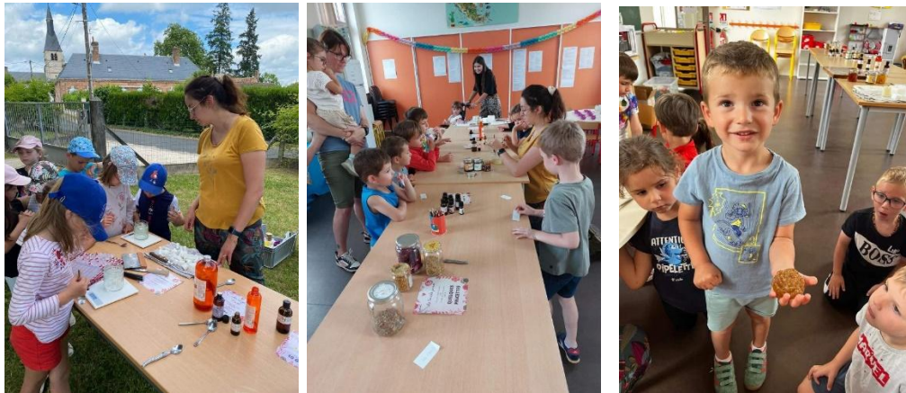
Atelier « savon au miel » avec Les belles demois'ailles