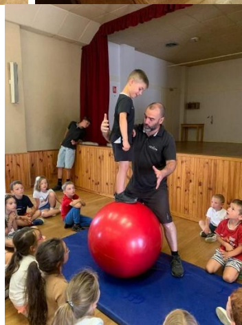
Atelier cirque avec PAKKAP