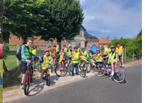
Camp à l'ALSH de Pierrefitte/Sauldre