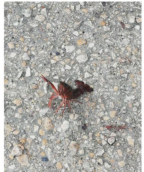
Écrevisse de Louisiane