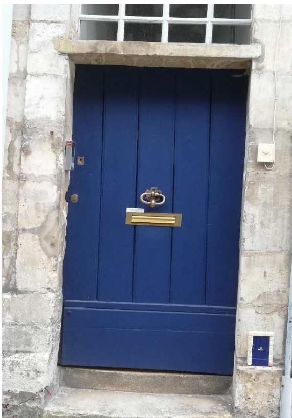
Porte de fées bleue en bas à droite