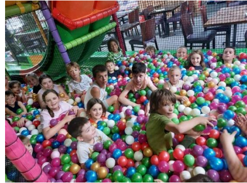
Récré des pirates