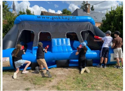
Journée PAKKAP : laser game, lancer de haches, shooting interactif, poneys mécaniques, structure gonflable