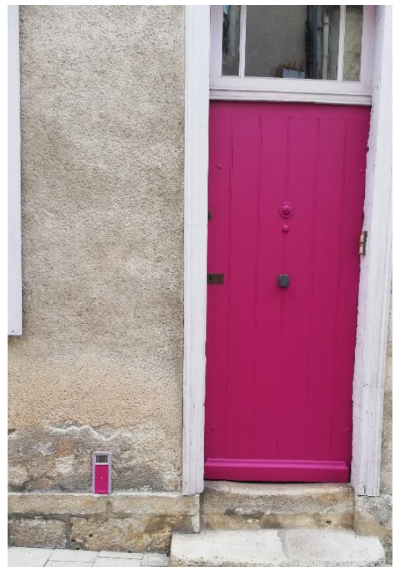
Porte de fées rose en bas à gauche