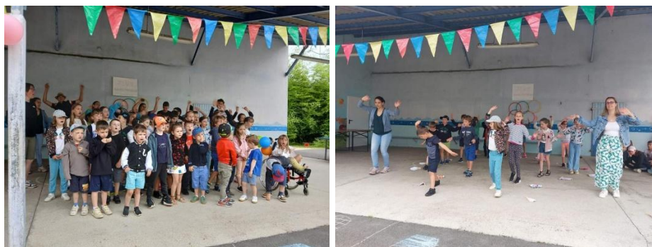
Préparation du spectacle