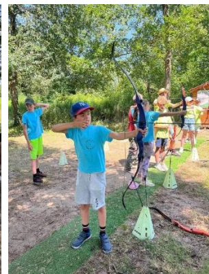
Loire Loisirs Valley