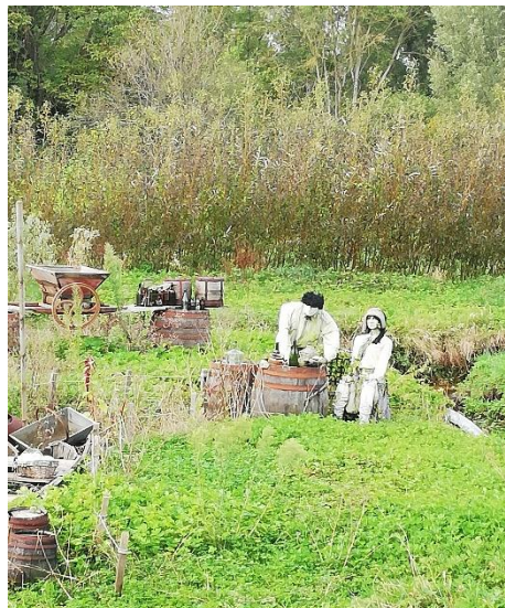
Couple de tenanciers